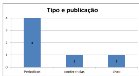
Gráfico 02 – Tipo de publicação