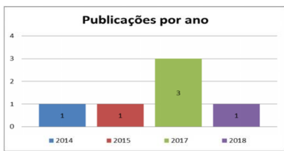
Gráfico 01 – Publicações por ano

A análise dos artigos possibilitou a identificação de uma pequena quantidade de pesquisas sobre o assunto, bem como a compreensão dos modos que o tema vem sendo abordado.